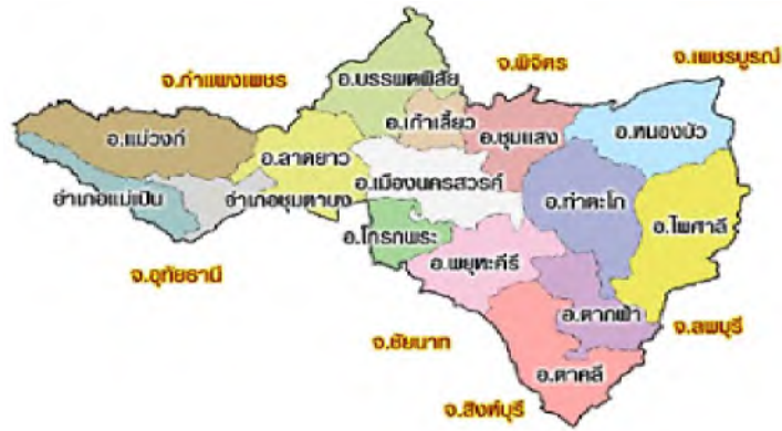
แผนที่จังหวัดนครสวรรค์