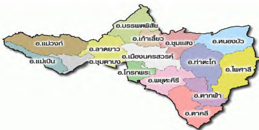
แผนที่จังหวัดนครสวรรค์