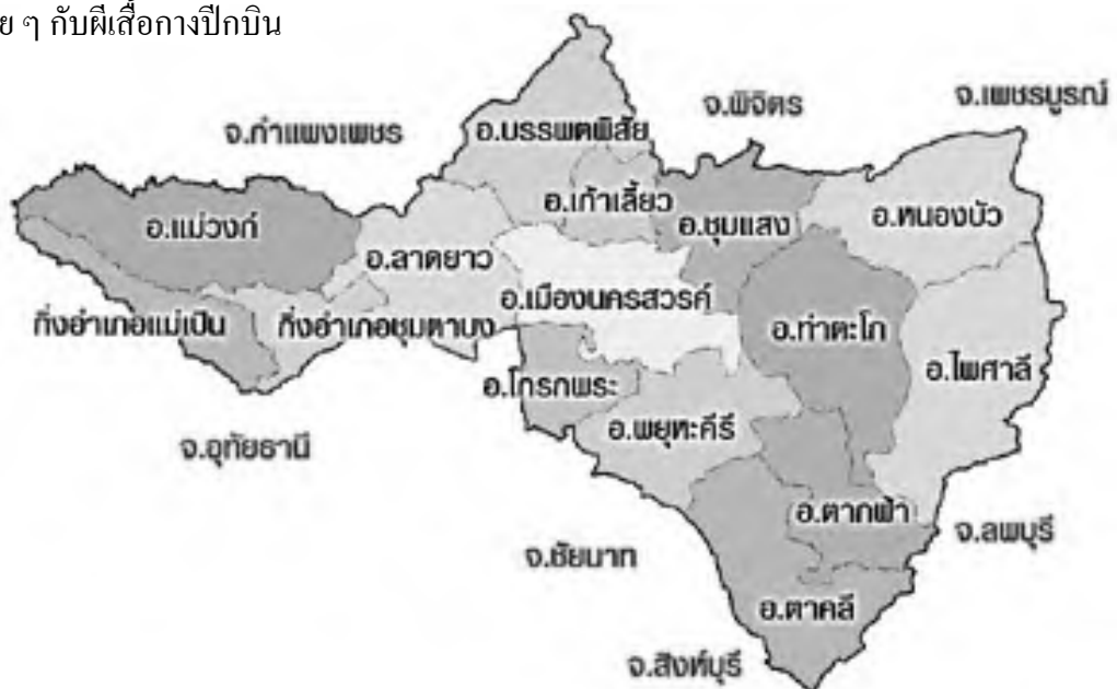
ภาพที่ 1-1 แผนที่จังหวัดนครสวรรค์

รูปร่าง ของจังหวัดนครสวรรค์มีลักษณะเป็นแนวยาวจากทิศตะวันตกกับทิศตะวันออก รูปร่างคล้าย ๆ กับผีเสื้อกางปีกบิน