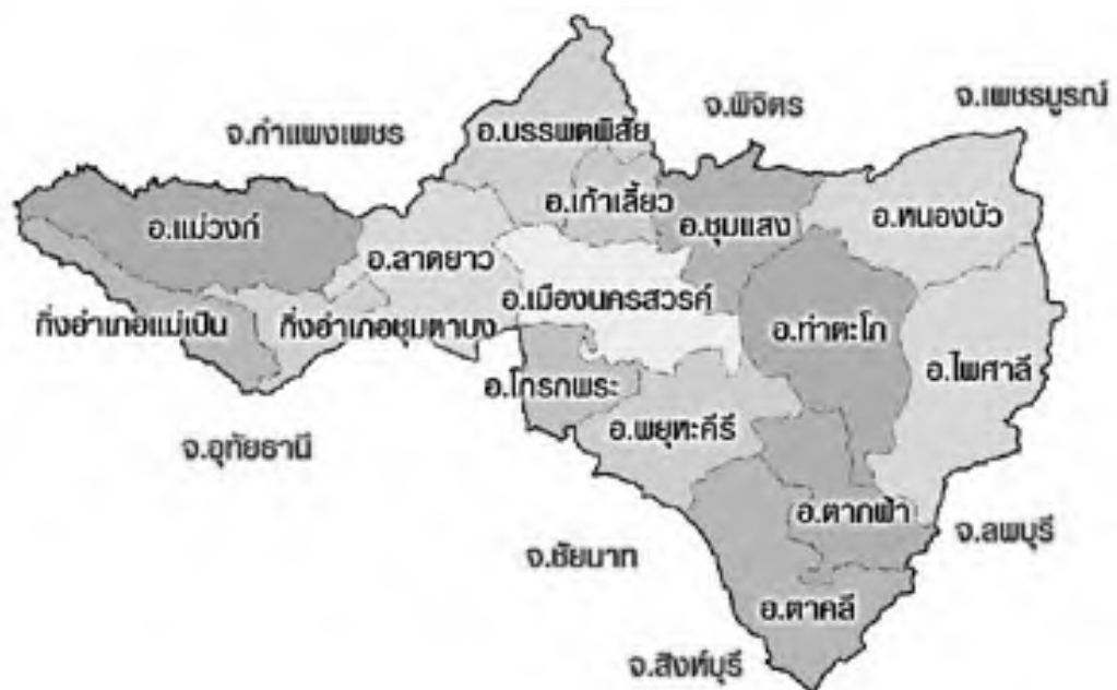
ภาพที่ 1-1 แผนที่จังหวัดนครสวรรค์

รูปร่าง ของจังหวัดนครสวรรค์มีลักษณะเป็นแนวยาวจากทิศตะวันตกกับทิศตะวันออก รูปร่างคล้าย ๆ กับผีเสื้อกางปีกบิน