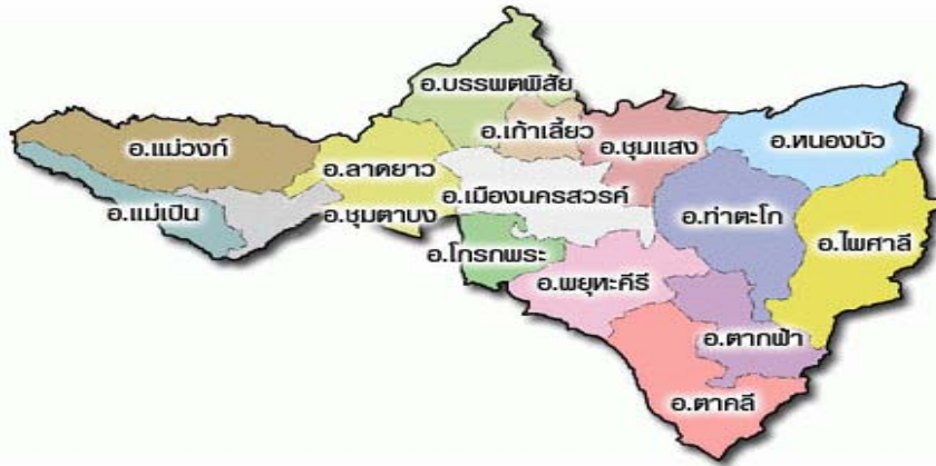
แผนที่จังหวัดนครสวรรค์