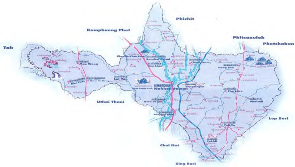
แผนที่จังหวัดนครศรีธรรมราช